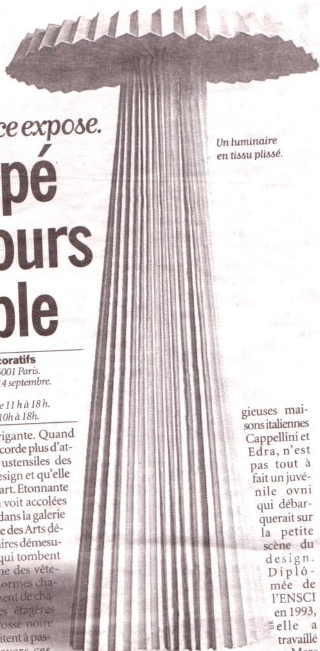
Un luminaire en tissu plissé.

Inga Sempé est intrigante. Quand elle décrète qu'elle accorde plus d'attention aux petits ustensiles des drogueries qu'au design et qu'elle ne s'intéresse pas à l'art. Étonnante encore lorsque l'on voit accolées ses quelques pièces dans la galerie d'actualité du musée des Arts décoratifs. Des luminaires démesurés en tissu plissé, qui tombent ou s'élèvent comme des vêtements, ou tels d'énormes chapeaux, et qui dessinent de chaleureux halos. Des étagères enveloppées de brosse noire ou blanche, qui invitent à passer la main à travers ces pagnes doux comme des «porc-et-pic», sans savoir pourquoi, ni ce que l'on va trouver à l'intérieur. Avec sa chaise chic en métal rembourrée de cuir, on ne sait sur quelle fesse s'asseoir. Inga Sempé refuse toute assise explicative à son travail et toutes références. Il faut donc attraper son univers fabuleux comme un petit théâtre en devenir, où se combinent des partis pris abrupts et une délicatesse sous-jacente. Cette lauréate 2003 du Grand Prix de la Ville de Paris, éditée par les presti-